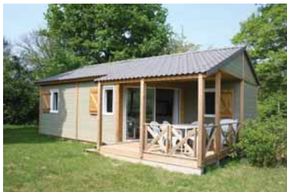
Camping du lac de Tuffé

Tél. 02 43 93 88 34 - www.camping.tuffe.fr