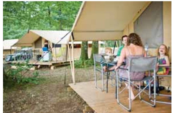
Tente Toile & Bois @Camping Indigo R. Etienne

Tél. 02 43 20 16 12 - www.camping-indigo.com