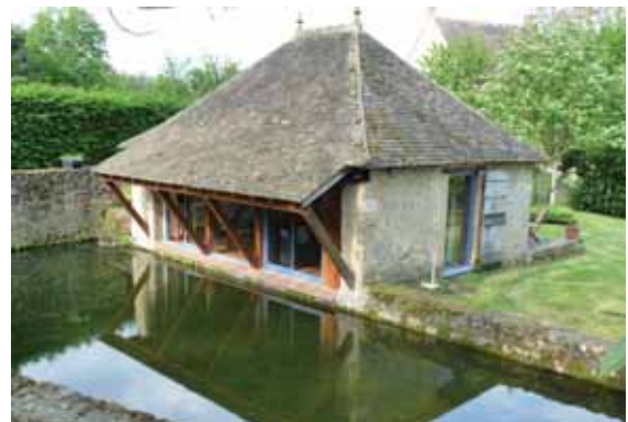
La Ferme du Prieuré