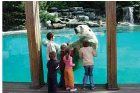
Parc zoologique de La Flèche

Principaux sites touristiques : le Zoo de La Flèche, la cathédrale Saint-Julien du Mans, les Bouleries Jump, Papéa Parc.