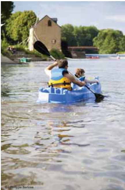
L'île MoulinS'Art

Week-end de tourisme fluvial sur la Sarthe (à partir de 420€ le week-end)