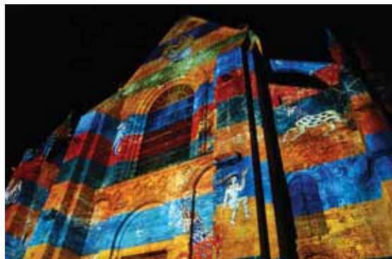
G. Moussé ©Création Skertzo pour la Mle du Mans