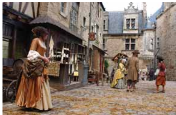
Tournage Jean de la Fontaine