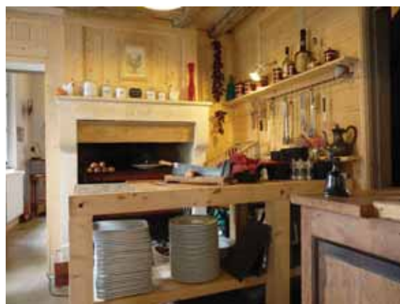
Les Mères Cocottes

Le midi pour une pause salée ou l'après-midi pour une pause sucrée, le Baccara est l'adresse idéale pour s'immerger dans une ambiance très cosy, dans cet ancien appartement du centre-ville du Mans, agencé en 3 salons. La déco est à emporter ! Tél. 02 43 21 78 37