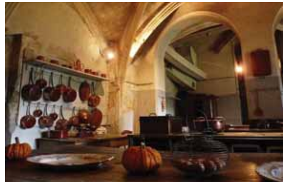
Cuisine Château du Lude @Sarthe Développement

www.hotel-ricordeau.fr - Tél. 02 43 88 40 03