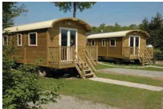
Camping de la Forêt

Tél. 02 43 957 757 - http://fermechauvet.fr