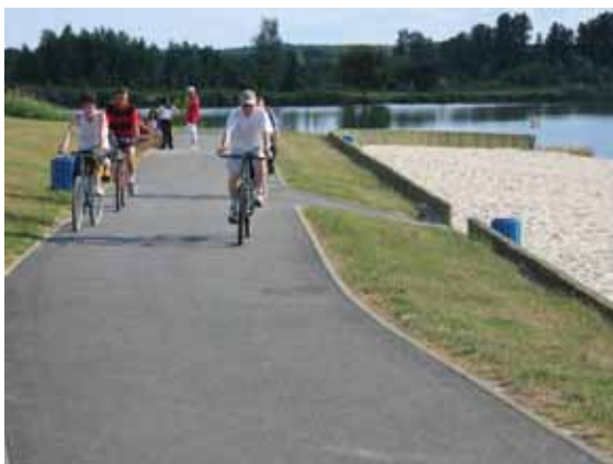
Voie verte

Au total, dans le sud de la Sarthe, 45 kilomètres de parcours relie Le Lude à Baugé, en Anjou. Une balade ponctuée par la visite du Château du Lude, fleuron de l'architecture de la Première Renaissance Française et ses jardins, les villages bordés par le Loir ou encore le parc zoologique de La Flèche. Un projet de connexion à la Loire à Vélo se dessine à l'horizon 2012-2013.