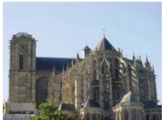
Cathédrale du Mans