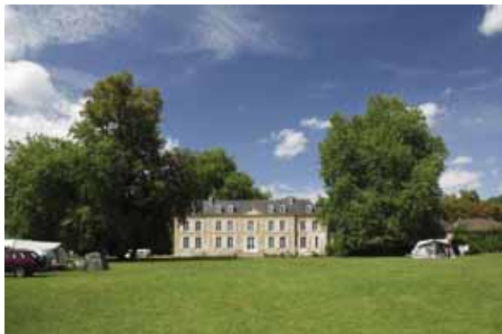
@Castel Camping de Chanteloup

Tél. 02 43 27 51 07 - www.chateau-de-chanteloup.com