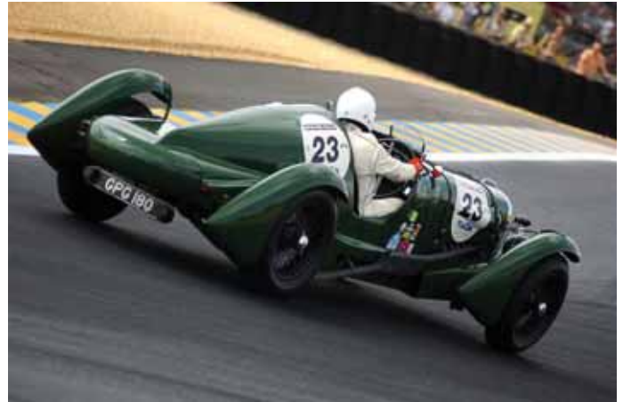
Le Mans Classic

Nos brochures ... en téléchargement sur www.tourisme-en-sarthe.com