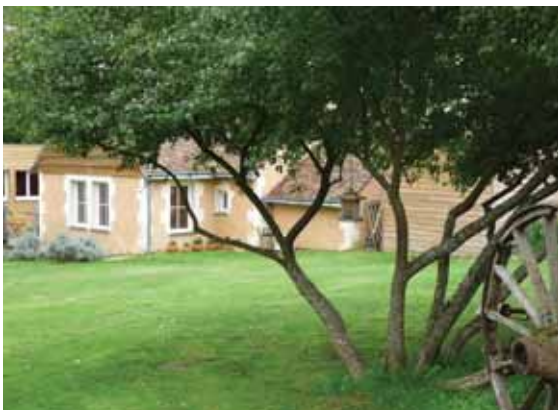
Le Moulin de la Diversière