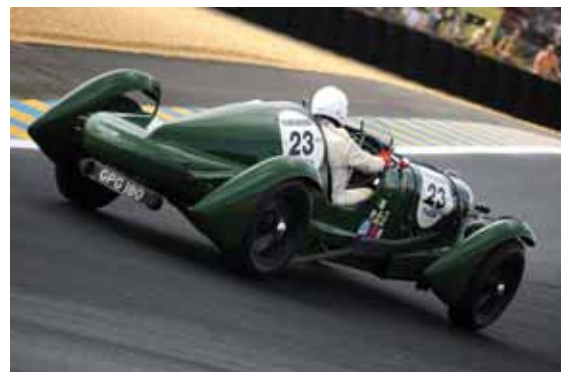
Le Mans Classic