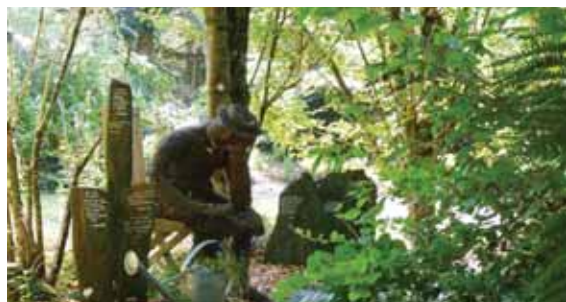
Jardin du Petit-Bordeaux