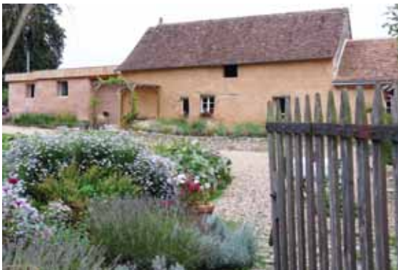
Le Moulin de la Diversière @Sarthe Développement

Tél. 02 43 48 09 16 - www.moulin-de-la-diversiere.com